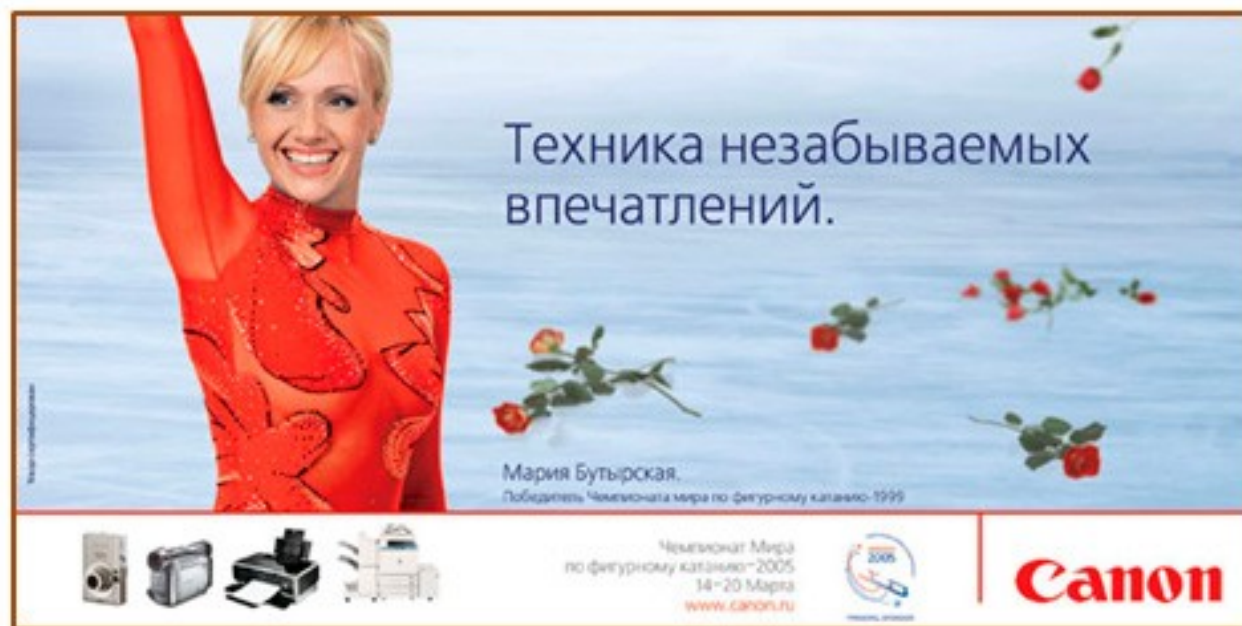
Наружная реклама 3x6

Наша первая работа с Canon. Анонс Чемпионата Мира по фигурному катанию. Canon являлся генеральным спонсором этого чемпионата. «Лицом бренда» Canon, на тот момент, была известная фигуристка Мария Бутырская.