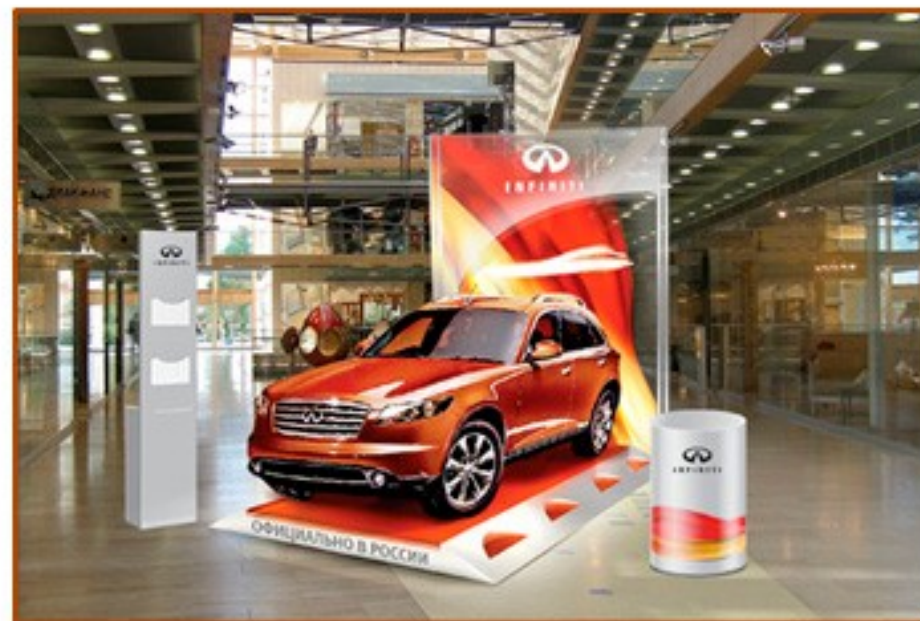
INFINITI. Стенд в Крокус-Сити