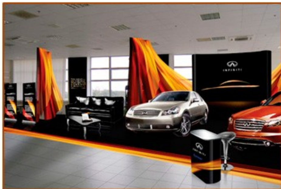
INFINITI. Дилерский центр